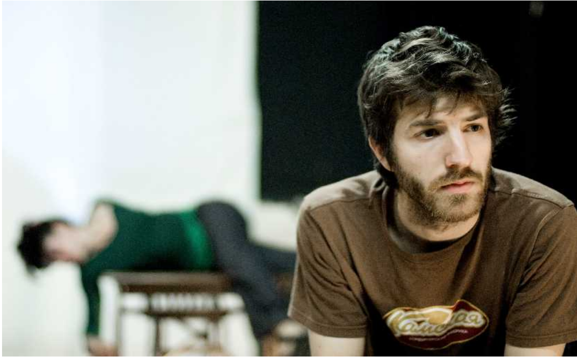
Ensayo de Memoria del jardín